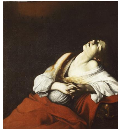
左：《リュート弾き》1596～97年頃 油彩/カンヴァス 個人蔵 右：《法悦のマグダラのマリア》1606年 油彩/カンヴァス 個人蔵