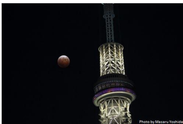
東京スカイツリーと赤銅色の皆既月食(イメージ)

総合光学機器メーカー、株式会社ビクセン（本社：埼玉県所沢市、代表取締役社長：新妻和重）は、東武タワースカイツリー（本社：東京都墨田区、社長：酒見重範）および東武タウンソラマチ（本社：東京都墨田区、社長：狩野伸明）が運営する東京スカイツリータウンにおいて、1月31日に合わせて開催される「皆既月食&ブルームーン 天体観測イベント」に協力、天体望遠鏡などを使って皆既月食を楽しみます。