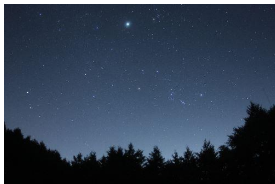
※冬の星空 イメージ写真

「やくらい星流フェス」の舞台となるのは宮城県加美町にある、広大な敷地に400種類もの草花が栽培されている庭園「やくらいガーデン」。自然豊かなこの場所で、日中は天体・宇宙に関する謎解きゲームや管弦楽団による音楽演奏会「Star Music」、夜には星空観望会や星空をイメージした会場内ライトアップなど、星にまつわる様々なコンテンツをお楽しみいただけます。