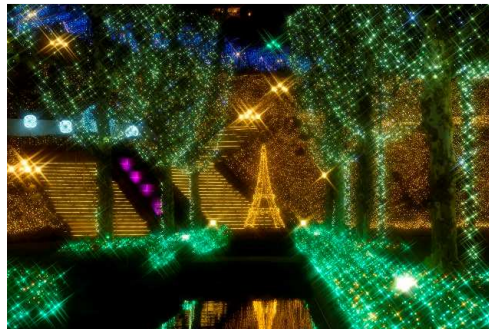
西武園ゆうえんち「イルミージュ」