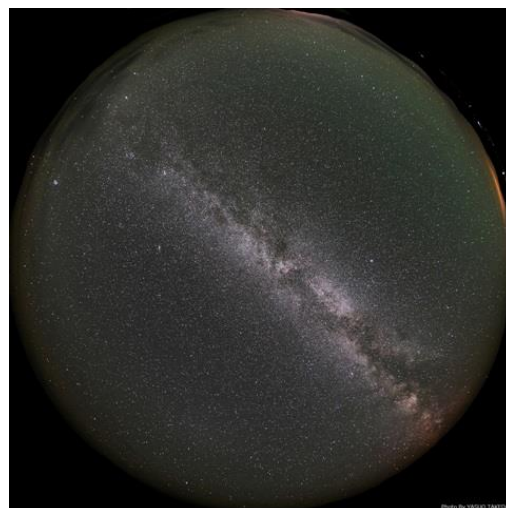
空を横切る天の川(全天)