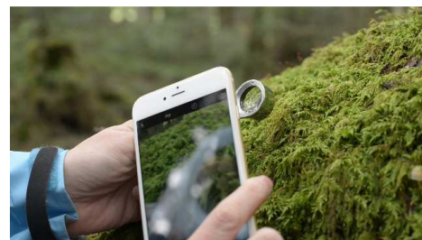
スマートフォンカメラを使用して苔を撮影

「ルーペ」は、コンパクトで携帯性の優れるメタルホルダールーペ。倍率は、苔の細部まで観察できる10倍を採用しています。また、ルーペとスマートフォンのカメラを使用すれば、苔の世界を拡大撮影することも可能です。セットのルーペは広い見口を採用しており、スマートフォンのカメラとの相性に優れています。付属の「リボンストラップ」をつければ、アクセサリのように首からさげて携帯できるので、苔を見つけたらすぐに観察できます。