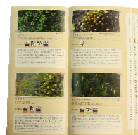
「コケ図鑑編」見開きイメージ